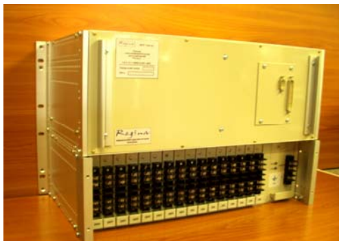
Інформаційно-діагностичний комплекс "Регіна"

На початку 80-х років минулого століття відділ автоматизації електричних систем, одним з перших в Україні, розпочав дослідження мікропроцесорних систем керування в енергетиці. Були проведені дослідження, розроблені принципи та створені мікропроцесорні системи для реєстрації параметрів нормальних та аварійних