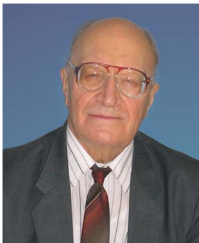
Академік. НАН України Г. Г. Счастливий

ктродвигунів і проблема надійності кінцевих зон потужних турбогенераторів. Крім зазначених проблем, у цей період у пошуковому плані проводилися дослідження деяких інших питань електромеханіки.