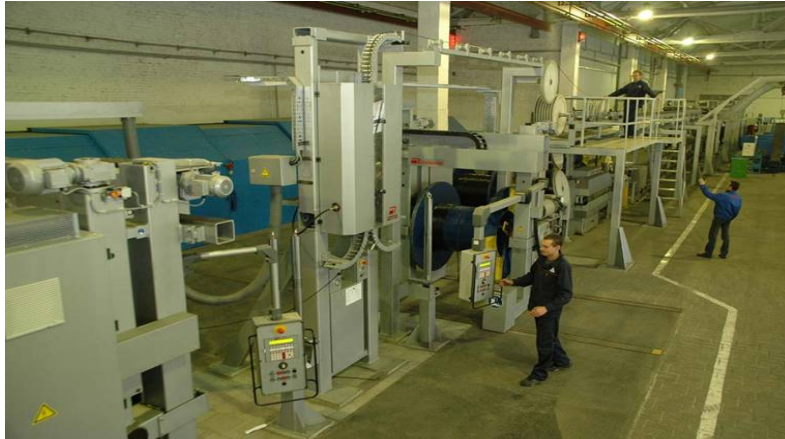
Технологічна лінія виготовлення кабелів із ЗПЕ-ізоляцією та самоутримних ізольованих проводів

технології виготовлення кабелів із силанольно зшитою поліетиленовою ізоляцією (ЗПЕ-ізоляцією) на напругу до 1кВ.