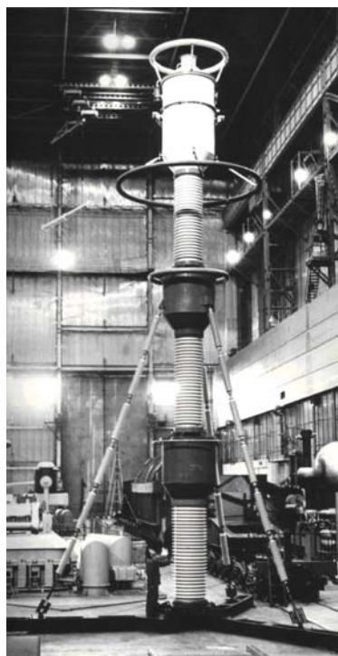
Каскадний трансформатор струму для першої у світі ЛЕП 1150 кВ

На основі цих розробок ВО "Київприлад" освоїло промислове виробництво трифазного багатофункціонального лічильника електроенергії типу "Каскад", який, забезпечуючи комплекс необхідних споживацьких власти-