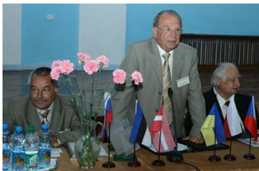
Академіки НАН України О. В. Кириленко, Б. С. Стогній, А. К. Шидловський на урочистому відкритті міжнародної конференції ПСЕ-2008

На базі інституту, а також за його активною участю регулярно проводяться міжнародні науково-технічні конференції та школи-семінари.