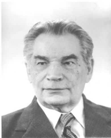
Чл.-кор. НАН України І. М. Постніков

Значний внесок учені інституту зробили в наукові дослідження, пов'язані з підвищенням ефективності та надійності процесів електромеханічного перетворення енергії. Основоположником цього напрямку був чл.-кор. НАН України І. М. Постніков. Під його керівництвом та керівництвом його учнів – академіка НАН України Г. Г. Счастлівого, докторів технічних наук А. І. Ліщенко, А. А. Войтеха, А. М. Кравченка, О. І. Тітка, Г. М. Федоренка, В. І. Виговського, В. А. Лісника, В. І. Смородіна, В. І. Кисленка, А. О. Афоніна, П. Ф. Вербового, Л. І. Мазуренка та багатьох інших – створена наукова школа, широко відома своїми науковими досягненнями не тільки в Україні та країнах СНД, а й далеко за їх межами.