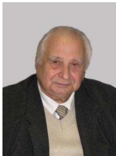
Академік НАН України А. К. Шидловський

Подальший розвиток теорії багатофазних коригуючих кіл і створення на її основі ефективних пристроїв багатофункціонального призначення для комплексного вирішення проблеми підвищення якості електроенергії в електричних мережах і системах загального