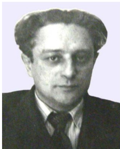
Чл.-кор. АН УРСР С. І. Тетельбаум

З моменту організації інституту в ньому проводяться науково-дослідні роботи, спрямовані на підвищення стійкості енергосистем. За розробку й впровадження пристроїв компаундування генераторів електростанцій для підвищення стійкості енергосистем і поліпшення роботи електроустановок академік АН УРСР С. О. Лебедєв і к.т.н. Л. В. Цукерник були удостоєні Державної премії за 1950 р.