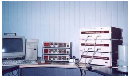
Еталонна система для вимірювання імпедансу СА5100

Одним з актуальних напрямків вимірювальної техніки є вимірювання малих та надмалих активних і реактивних опорів (мікроіндуктивностей, у тому числі індуктивностей розсіювання, опорів підвідних проводів тощо). Дослідження, що проведені у відділі, дали змогу розробити спеціальний клас мостових кіл, в яких забезпечується ефективний захист від впливу опору проводів підключення та контактів, режим заданого струму об'єкта вимірювання (що дозволяє вимірювати опір, починаючи з ну-