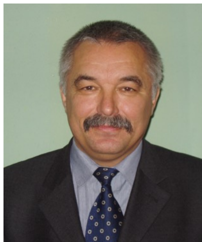
Академік НАН України О. В. Кириленко

ЕЕС та ефективність їх функціонування. У результаті виконаного спільно з Всесоюзним інститутом трансформаторобудування і Запорізьким заводом високовольтної апаратури комплексу науково-дослідних і дослідно-конструкторських робіт була розв'язана важлива народногосподарська задача: розроблено теорію, принципи побудови та методи випробування й на цій основі створено нове покоління вимірювальних перетворювачів (ВП) струму, які вперше у вітчизняній практиці високовольтних вимірювань струму забезпечують нормовані метрологічні характеристики як у статичних (усталених) режимах, так і в динамічних (аварійних) режимах ЕЕС. Найбільш вагомим практичним результатом цих робіт стала організація на виробничому об'єднанні "Запоріжтрансформатор" серійного виробництва каскадних триступневих ТС для першої у світі ЛЕП напругою 1150 кВ Екібастуз –Урал.