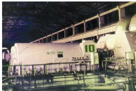
Перший у світі асинхронний турбогенератор АСТГ-200

У цей же період за ініціативою І. М. Постнікова в інституті активно розгорнулися дослідження з проблеми створення потужних асинхронних генераторів. Цей новий тип генераторів в умовах електроенергетики, що розвивається, може істотно підвищити ефективність функціонування системи "електростанція - енергосистема". Основний обсяг досліджень електромагнітних і теплових процесів у генераторі даного типу потужністю 200 МВт (АСТГ-200) виконано в інституті у співробітництві з ученими КПП.