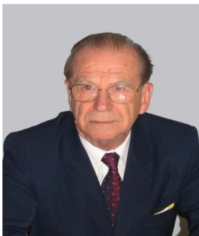
Академік НАН України Б.С.Стогній

Наприкінці 60-х років минулого століття під керівництвом к.т.н. Б. С. Стогнія у відділі було розпочато глибокі наукові дослідження високовольтних вимірювальних перетворювачів струму та напруги, які є основними й найбільш масово використовуваними джерелами вимірювальної інформації про режими роботи електроенергетичних об'єктів (ЕЕО). Трансформатори струму (ТС) і напруги (ТН), що є такими перетворювачами, утворюють домінуючий внесок у похибки передачі інформації про струм та напругу від контрольованого ЕЕО до вторинних систем електроенергетики, а саме: систем вимрювання, обліку електроенергії, релейного захисту та автоматики, і, таким чином, значною мірою визначають рівень технологічного керування