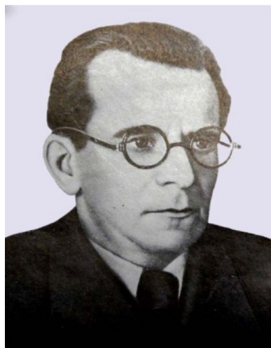
Академік АН УРСР С. О. Лебедев

До планів інституту було включено тему з експериментального дослідження режимів енергосистем, яка мала комплексний характер і виконувалась більшістю працівників електротехнічного відділу під загальним керівництвом академіка АН УРСР С. О. Лебедева. Було проведено розробку, виготовлено промисловий зразок і виконано успішні промислові дослідження компаундування синхронних генераторів з електромеханічним коректором напруги, досліджено характеристики швидкісного регулятора турбін, розроблено спеціальні пристрої для вимірювання кута вибігу синхронних машин та лічильник для врахування втрат у мережах. Ці дослідження були цінним вкладом у нау-